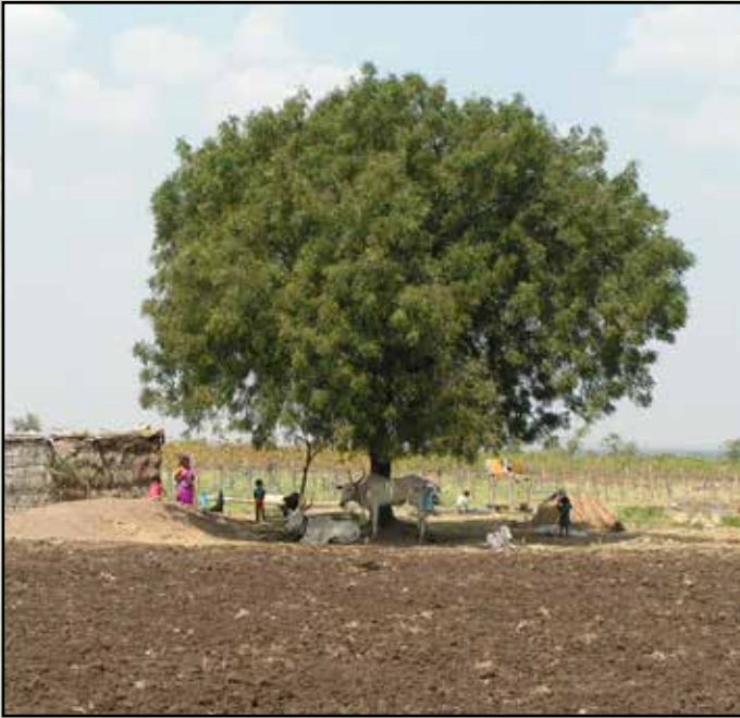
Het Neem project

In eerdere verslagen hebben we al laten weten dat de klimaatverandering een steeds belangrijkere factor wordt. We zijn al een tijd aan het onderzoeken hoe we kunnen bijdragen aan een verantwoord watermanagement in de gehele regio. We hebben een subsidieaanvraag gedaan bij RVO (Rijksdienst voor Ondernemend Nederland – één van de diensten die deel uitmaken van het Ministerie van Economische Zaken) om bij te dragen aan een project waarin we de verschillende partijen in het gebied bij elkaar willen brengen, die nodig zijn om tot een verantwoord regionaal watergebruik te kunnen komen. In december zullen we bericht krijgen of onze aanvraag wordt gehonoreerd.